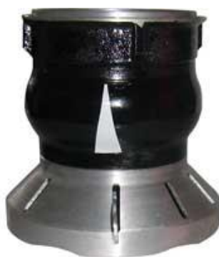
Sací koš Profi II