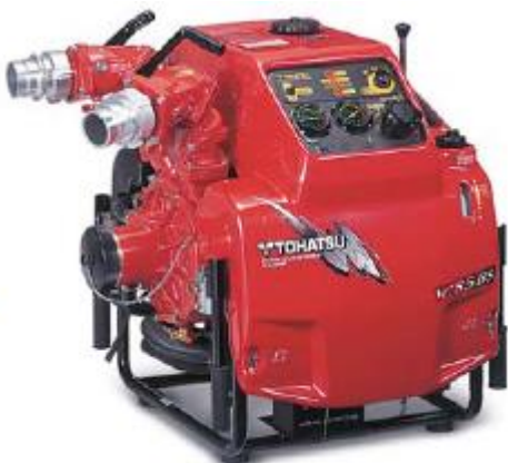
Přenosná motorová stříkačka Tohatsu VC85BS