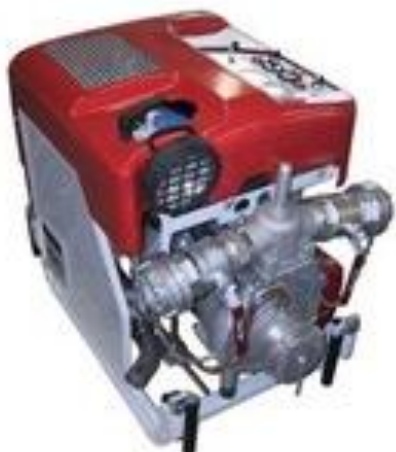
Přenosná motorová stříkačka PFPN 10-1000 KOMFI