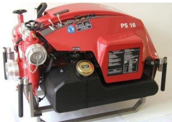
Přenosná stříkačka PFPN 10 -1500