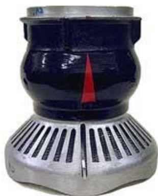
Sací koš Profi I